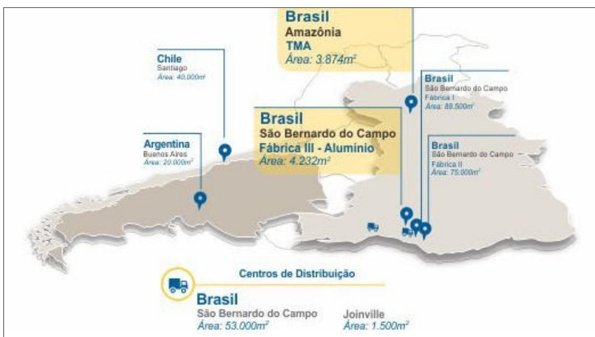
Figura 3. Mapa de expansão da empresa

Em 2010, a empresa se expandiu para o Chile e Argentina, através da compra das fábricas da CEMBRAS. Estas, por sua vez, passaram a compor o grupo Termomecânica e essas unidades produtivas no exterior experimentam constante investimento em novas tecnologias e aquisição de equipamentos que contribuem para a qualidade dos produtos da empresa e que resultam no aumento da produtividade e ampliação no mercado nacional e internacional. Já em 2016, a empresa abriu sua fábrica em Manaus, que conta com a produção de tubos de cobre e ingressa no mercado de alumínio com a produção de tubos e barramentos de alumínio.